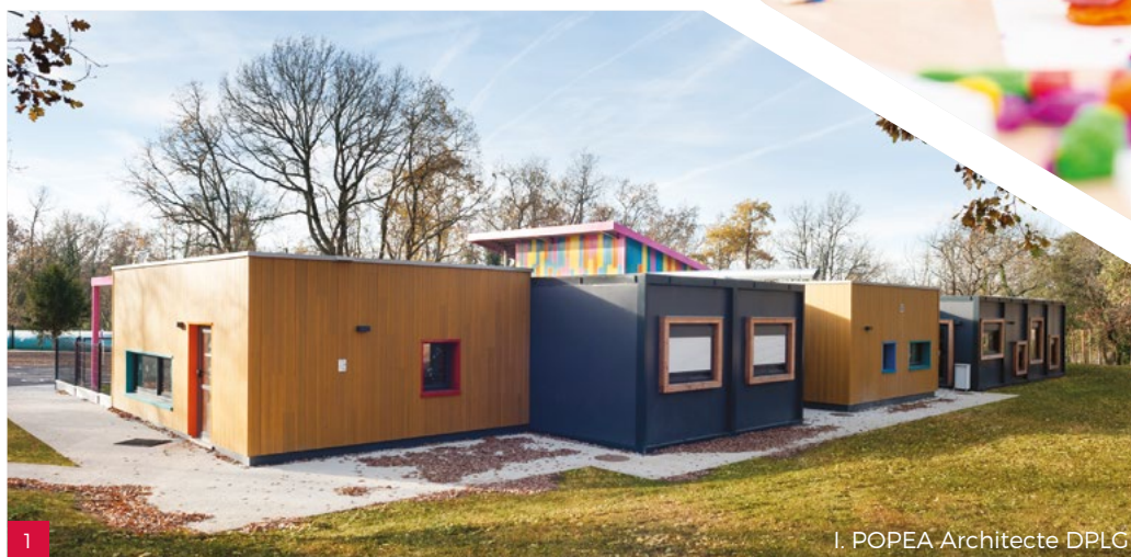
1. I. POPEA Architecte DPLG